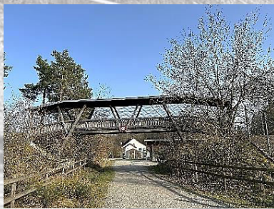
Brücke 15: Wildpark Bruderhaus (unterquert)