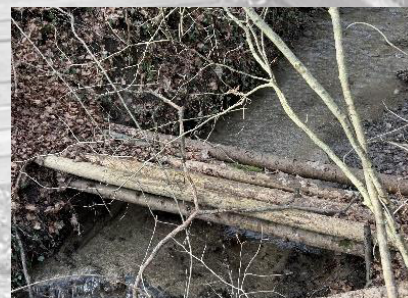
Brücke 18: Steg beim Abstieg nach Töss (passiert)