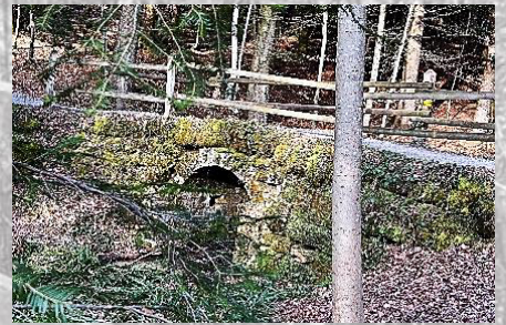
Brücke 16: Tugbruggli (passiert)