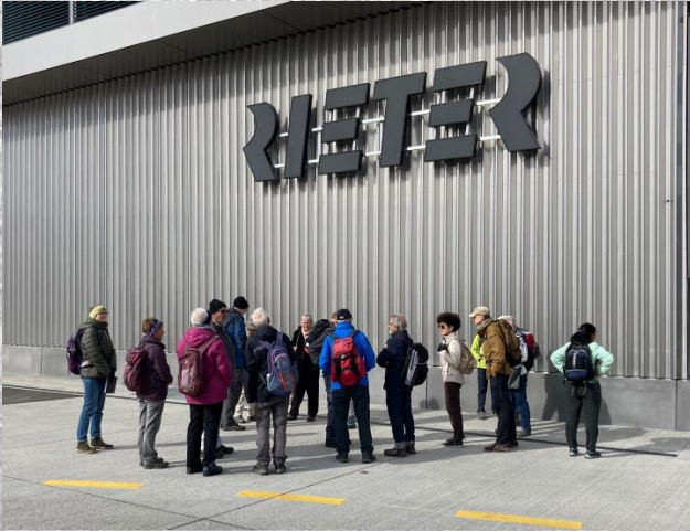
Besammlung in Töss