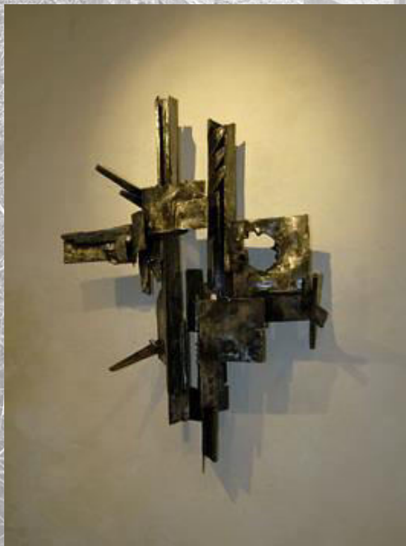
Das Kreuz, gestaltet vom Eisenplastiker Silvio Mattioli