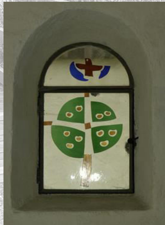
Kirchenfenster, gestaltet vom Kunstmaler Hans Affeltranger