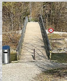
Brücke 9: „Chinesenbruggli“ (1. Mal passiert; 2. Mal überquert)