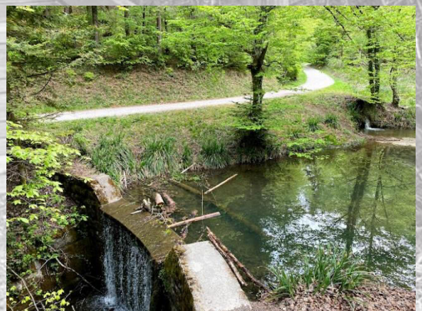
... beim schönen Sternenweiher