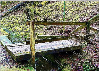
Brücke 14: Steg unterhalb Bruderhaus (passiert)