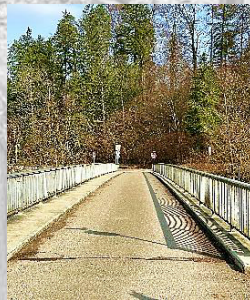
Brücke 5: an der Töss (Fuss) (passiert)