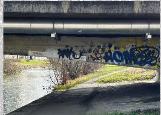
Brücke 3: an der Töss (Auto) (unterquert)