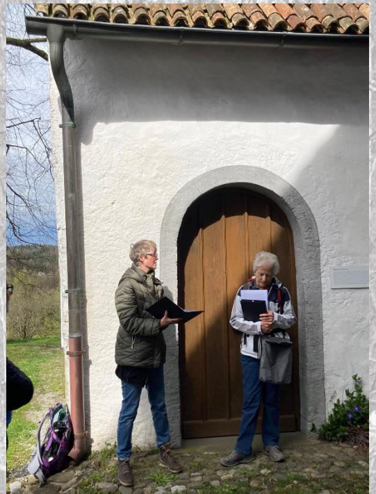
4. Atempause ...