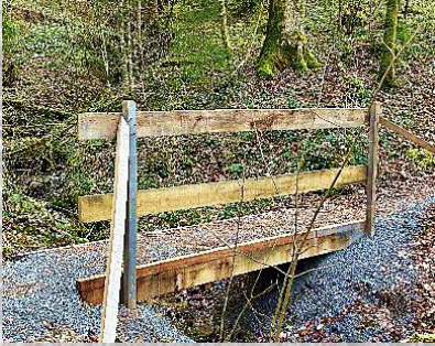
Brücke 11: Aufstieg zum Rossberg (überquert)