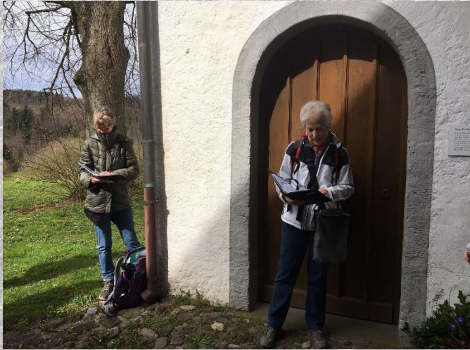
2. Atempause bei der Rossberg-Kapelle