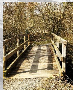
Brücke 6: bei den Pünten (überquert)