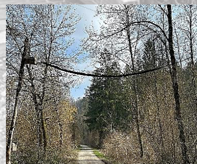
Brücke 10: Haselmaus-Brücke (unterquert)