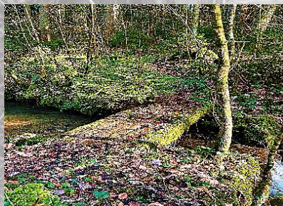
Brücke 17: Steg beim Abstieg nach Töss (passiert)