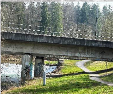
Brücke 4: an der Töss (Bahn) (unterquert)