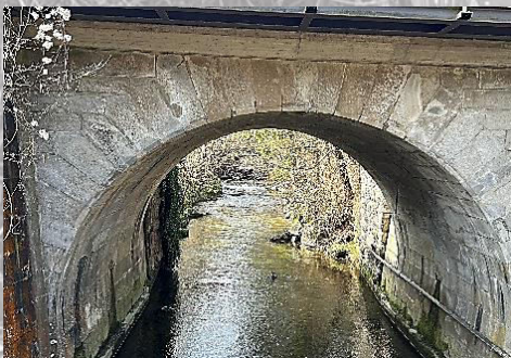
Brücke 8: Eisenbahnbrücke (passiert)