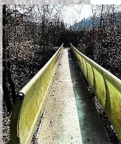
Brücke 7: aus Kunststoff (überquert)