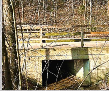
Brücke 12: Autobrücke beim Reitplatz (passiert)