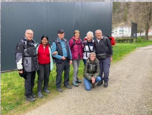
zurück in Töss