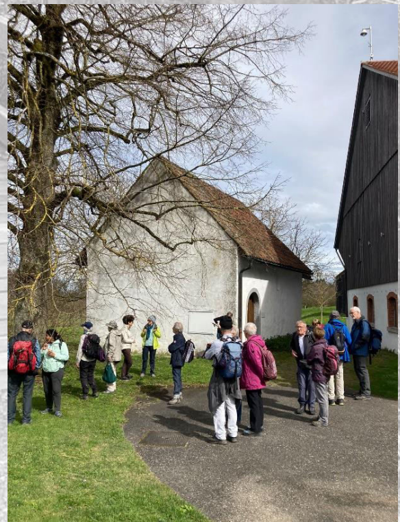
Pause auf dem Rossberg