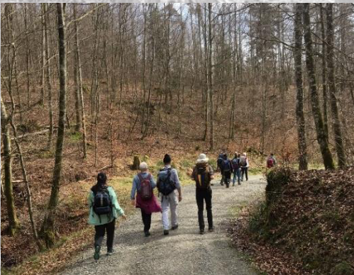
Abstieg zum Bruderhaus