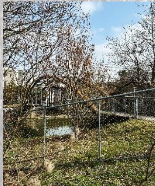
Brücke 2: Rieter Töss (passiert)