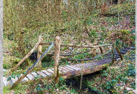
Brücke 13: Steg nach dem Sternenweiher (passiert)