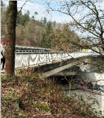
Brücke 1: Start in Töss (überquert)