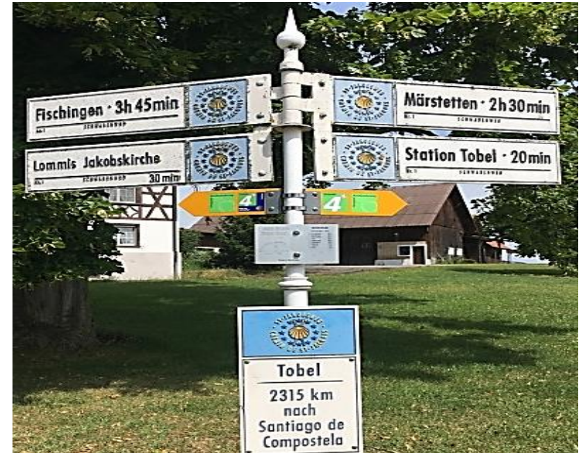
Auf dem Jakobsweg durch die Schweiz

Heinz Würms ist in mehreren Etappen von Oberwinterthur nach Lourdes am Fusse der Pyrenäen gepilgert. Mit eindrucksvollen Bildern lässt er uns teilhaben an seinen intensiven Erfahrungen.